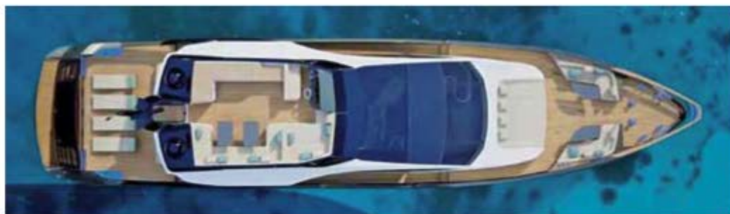
Schlank, sportlich, elegant: Azimut Grande S10.